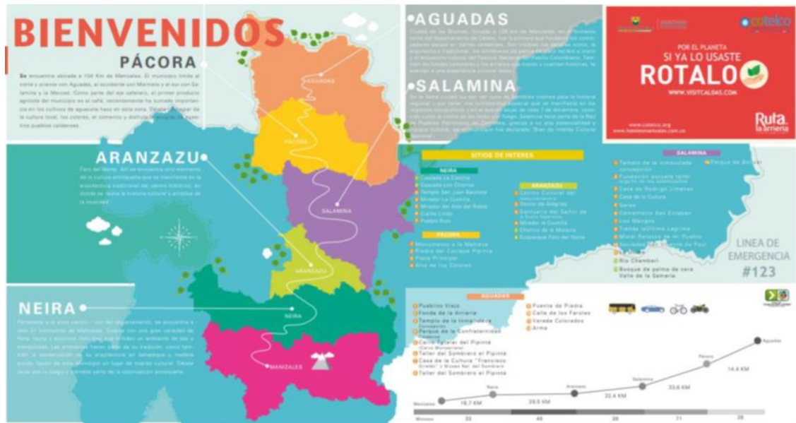
FIGURA 13. RUTA DE LA ARRIERÍA EN CALDAS