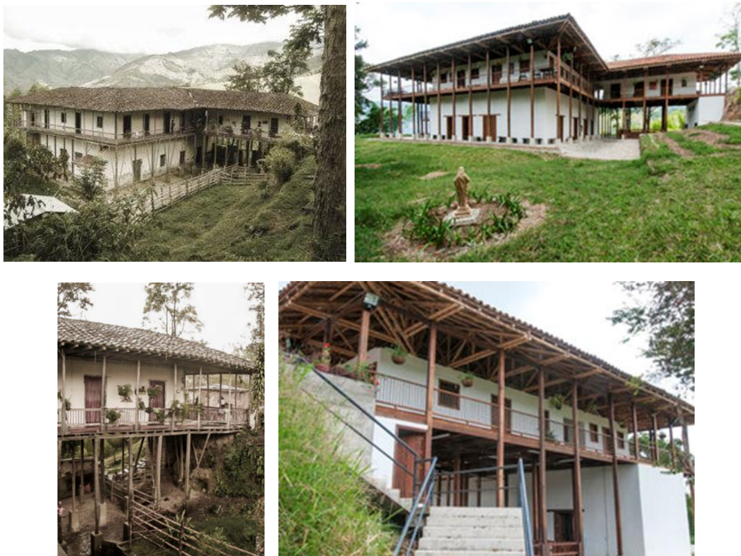
Fotos 7. Remodelación Fonda de la Arriería 3

cerchas previamente inmunizadas. El alero sobresale 1m el cual tiene como elemento arbotante una serie de columnas o pie de amigos perimetrales en madera chanú apoyados en dados de concreto que delimitan los pasillos exteriores. El bahareque encementado como sistema constructivo surge en muros divisorios del salón para exposición, cocina, restaurante y áreas de servicios. La carpintería de puertas y ventanas es en madera entamborada, la escalera interna en madera y la externa en concreto que posa sobre en una plataforma de este mismo material (Anexo 4: Proyecto Centro de Interpretación del PCCC – UNESCO. Predio Fonda de La Arriería – Salamina).