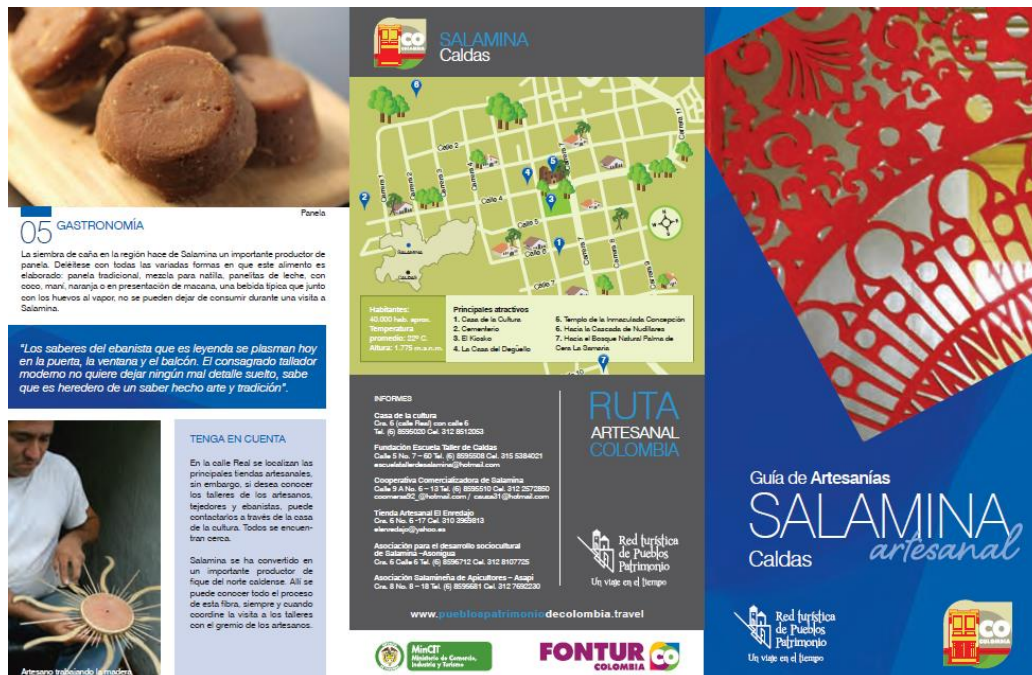
FIGURA 11. RUTA ARTESANAL COLOMBIA - GUÍA DE SALAMINA ARTESANAL