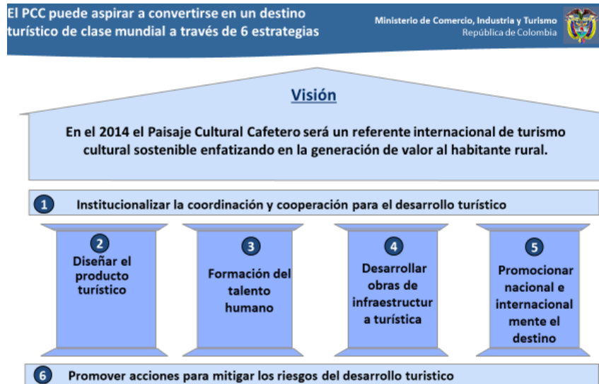
FIGURA 10. VISIÓN PCCC AL 2014