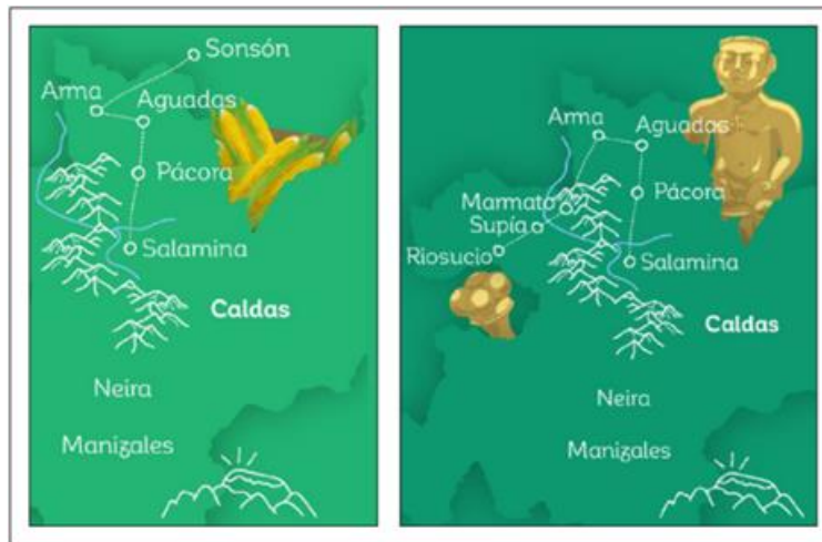
FIGURA 14. RUTA DE LA COLONIZACIÓN ANTIOQUEÑA