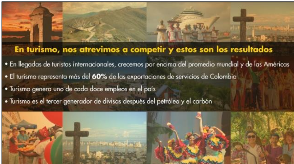
FIGURA 9. EN TURISMO, NOS ATREVIMOS A COMPETIR Y ESTOS SON LOS RESULTADOS