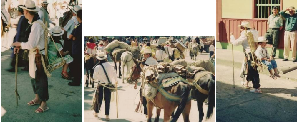
Fotografías 5, 6 y 7. Festival del Camino del Quindío. Fotos de los primeros Festivales del Camino del Quindío.