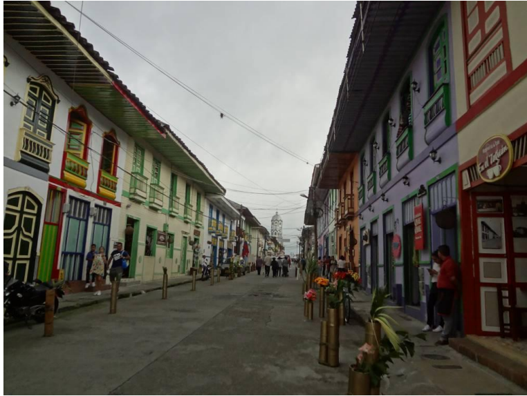
Fotografía 1. Calle del Tiempo Detenido.