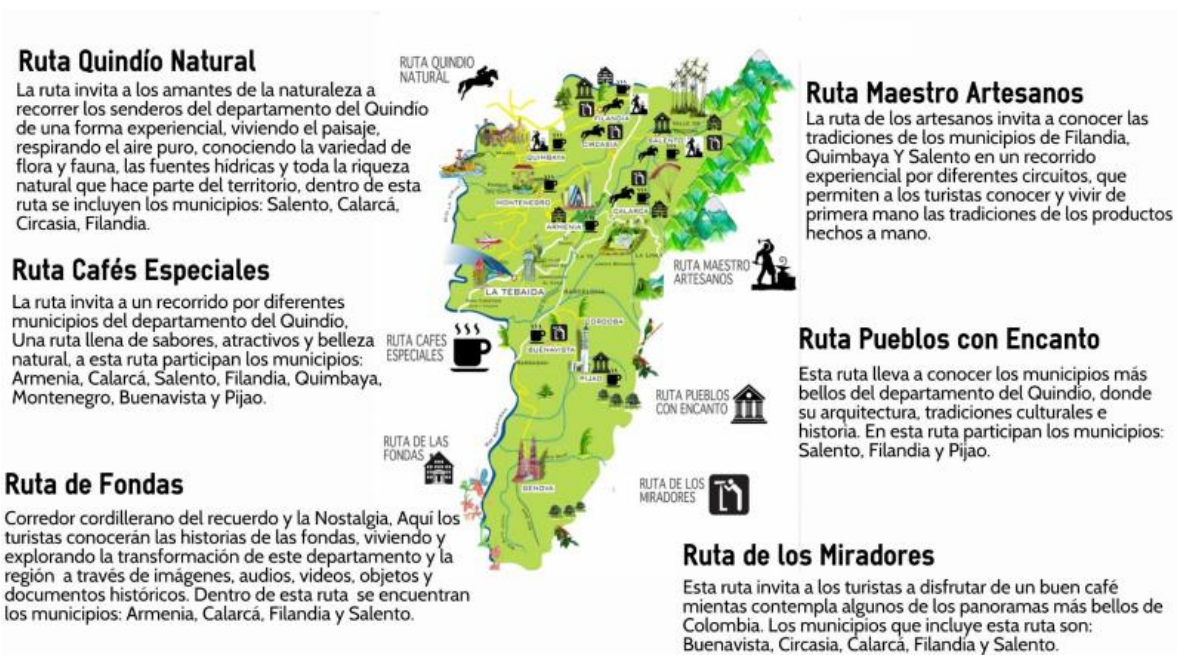
Gráfico 4. Rutas del Paisaje Cultural Cafetero.

En un proyecto con la Cámara de Comercio de Armenia y el Quindío, se elaboraron experiencias turísticas para las Rutas del Paisaje Cultural Cafetero y 50 Experiencias para disfrutar por la Gobernación del Quindío que incluyen: la Reserva Barbas Bremen (aviturismo), el Mirador Colina Iluminada, el Paseo a las cascadas de Filandia, el Centro de Interpretación del Bejuco al Canasto y el Avistamiento del mono aullador en la vereda Cruces. Filandia por tanto tiene reconocimiento y figura en los procesos de desarrollo turístico a nivel local, departamental, regional y nacional. Sin embargo, los productos enunciados carecen de presencia y visibilidad, en Filandia es predominante la visita de fin de semana con la vuelta del parque, la visita de los miradores y el uso de los restaurantes siendo un destino de fin de semana (Alcaldía de Filandia, 2017).