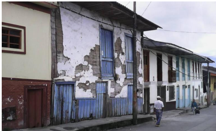
Fotografía 2. Patrimonio arquitectónico en detrimento.

El Camino del Quindío es un elemento de alto valor histórico y cultural, un tramo del denominado Camino Nacional, que a principios del siglo XIX fue la única vía para comunicar a Popayán con Santa Fe de Bogotá. Entre finales del siglo XVIII y 1841 fue el camino del comercio de ganado y cerdos, de Buga a Cartago y de allí a Ibagué y todas las provincias aledañas; también de las mercaderías que llegaban por el río Magdalena hasta Honda, luego a Ibagué y de allí a Cartago; de las cargas de oro que salían de las minas del Chocó, vía Cartago, de aquí a Ibagué, Santa Fe y España por el río Magdalena; pero también fue el camino de las expediciones científicas, como la Botánica de Mutis y Caldas, o como la geográfica de Von Humboldt. Durante el período de 1810-1841 el Camino fue la vía de las incursiones militares de la independencia (Duis, 2011).